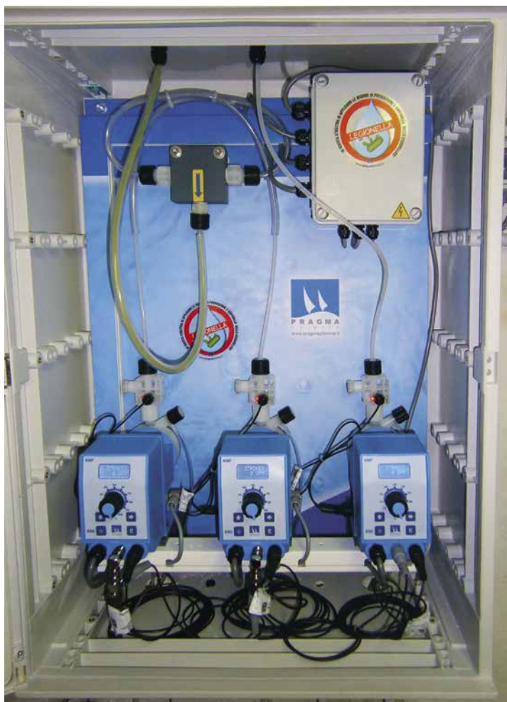
Impianto di dosaggio Biossido di Cloro stabilizzato con attivatore e filmante protettivo per acque sanitarie. Il tutto pre-assemblato su un box di protezione IP65 con sistema di comunicazione dati ed errori tramite modulo Ethernet.