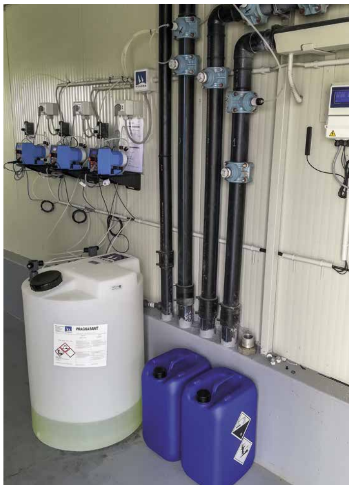
Impianto di clorazione con prodotto Pragmasanit su tre diverse linee, con controllo degli allarmi mediante modulo GSM.

Prevenire e risolvere sono le attività necessarie, contattaci per avere maggiori informazioni in merito. Esperti consulenti a Vostra disposizione sapranno aiutarvi per trovare la soluzione migliore.